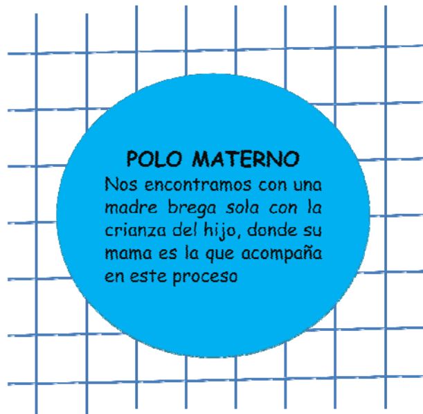
Gráfico nº 07