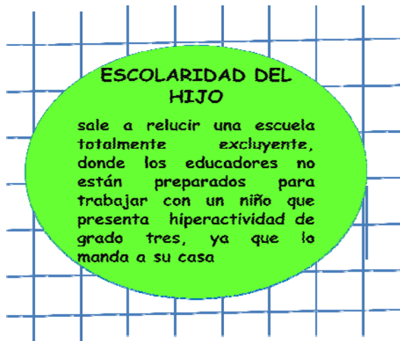
Gráfico n° 08