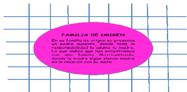
Gráfico nº 04

Esta madre que también es abuela continua siendo madre en la crianza de su nieto, ya que ella manifiesta su preocupación con la escolaridad del nieto que presenta grado de hiperactividad 3 y es difícil controlarlo en las aulas de clase. No solo vemos a la abuela ser madre del nieto en la escolaridad del nieto, sino también las veces que tuvo que cuidarlo mientras la historiadora tenía que trabajar.