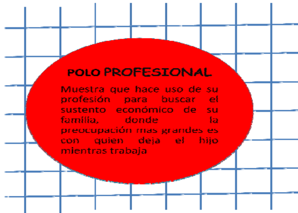
Gráfico n° 06

historiadora primero esta su hijo y su familia que una mejor oportunidad de trabajo.