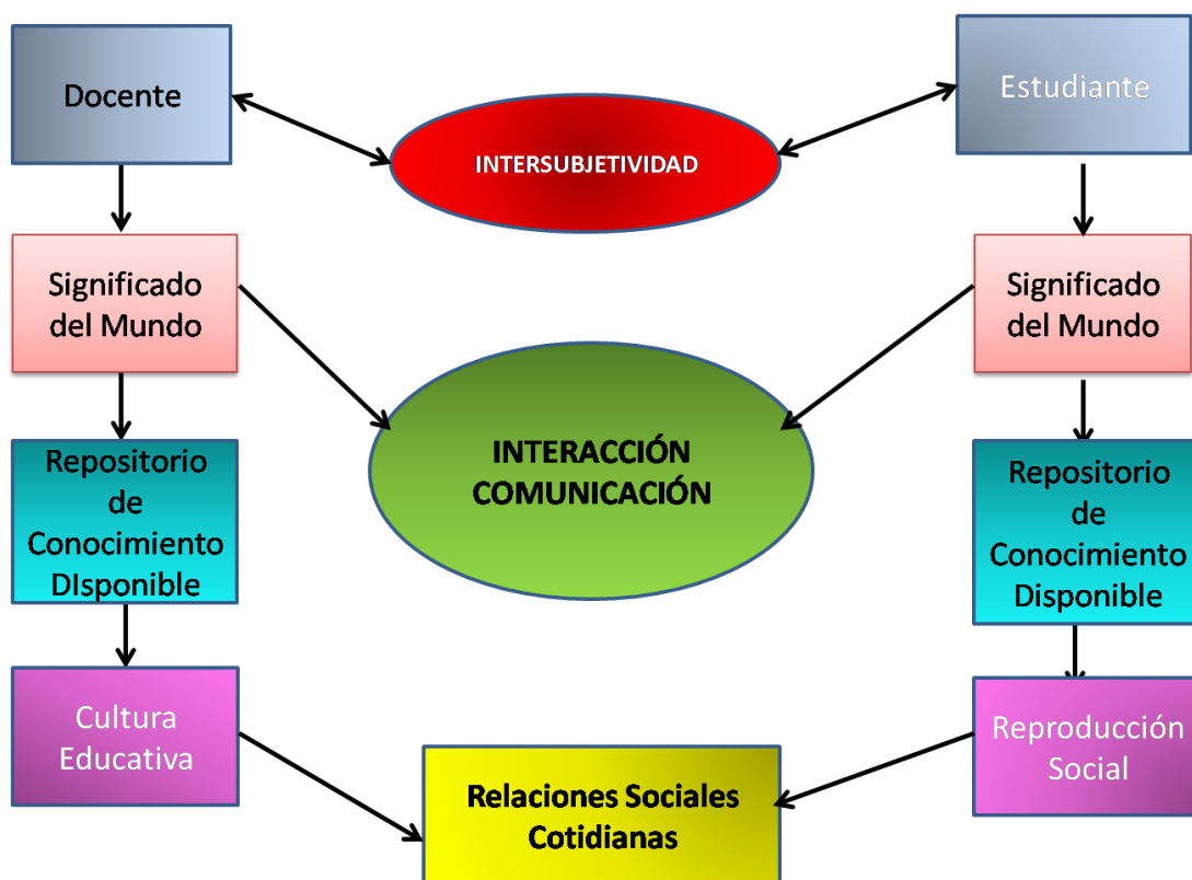
FIGURA N° 1: Comunicación e interacción desde la Cultura Educativa y la Reproducción Social.

cotidiana se acerca a los congéneres y se aleja de los contemporáneos. Así como lo señalado, por Martínez García (2008), en el sentido que la cotidianidad, sea contextualizada como un fenómeno cultural complejo.