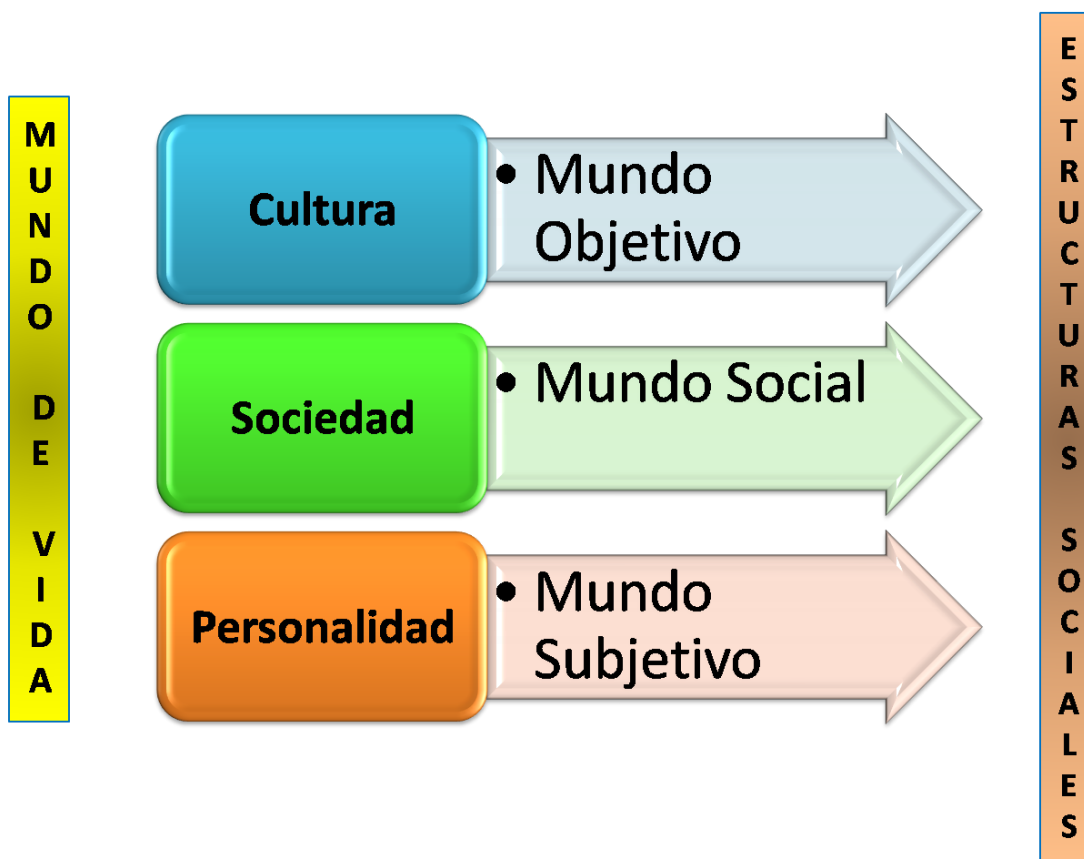
FIGURA N° 2: Integración social (mundos de vida) e integración de las estructuras sociales.